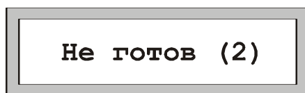
Рис. 4 Сообщение о неготовности зоны

В случае неготовности зоны к постановке на охрану в скобках будет указано число неготовых ШС (Рис. 4).