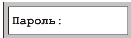
Рис. 2 Авторизация пользователя

Для перевода ПУО в режим ввода команд пользователя необходимо произвести авторизацию, т.е. регистрацию в БЦП. Для вывода на дисплей окна авторизации (Рис. 2) нажать любую клавишу. Далее ввести пинкод зарегистрированного в БЦП пользователя и нажать «#».